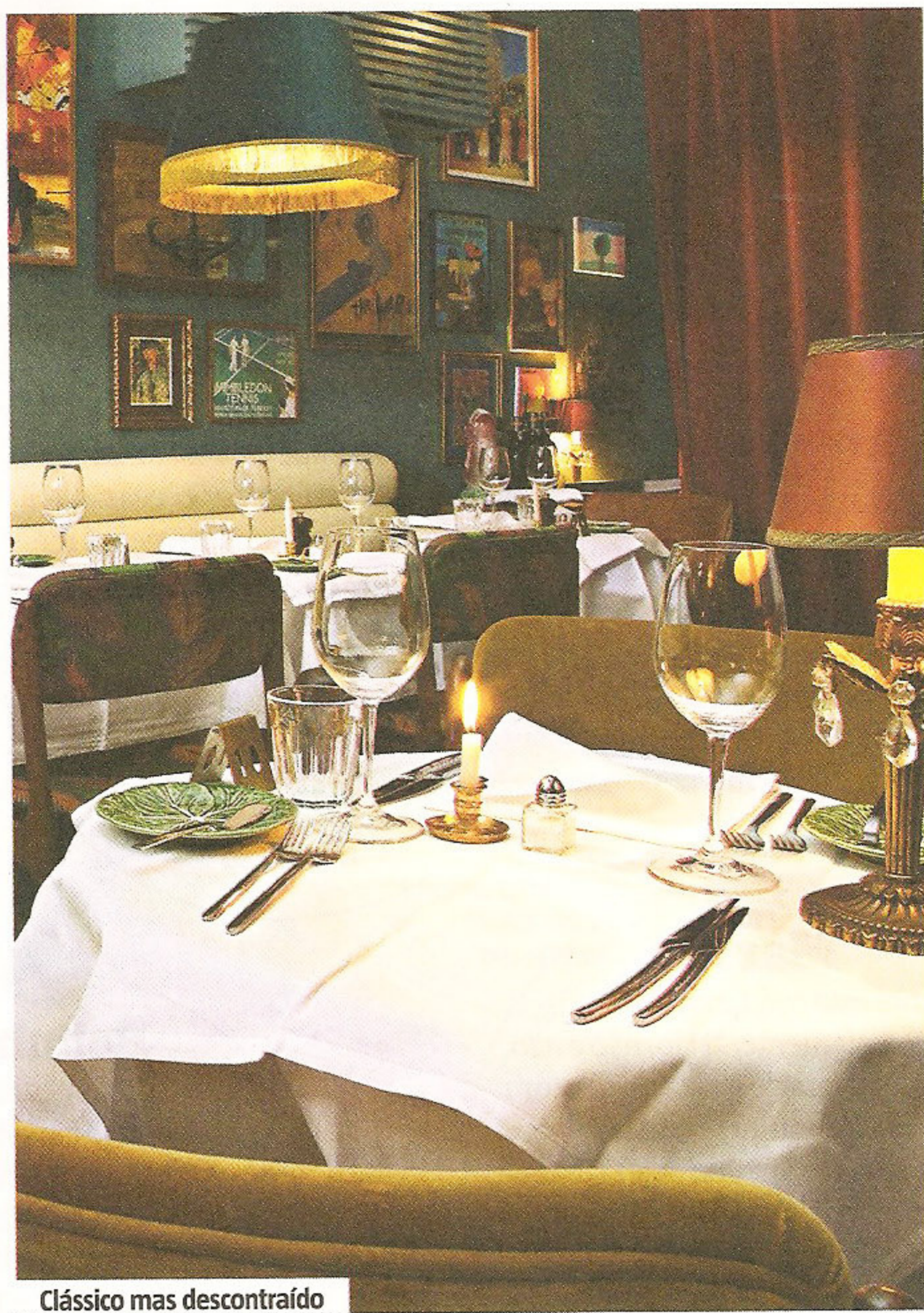
Clássico mas descontraído

Lisboa :: Sommer :: R. da Moeda, 1-K, Lisboa :: Tel. 213 905 558 :: Fecha ao dom. e ao jantar de 2ª e 3ª :: Horário 12h30-15h e 20h-02h :: Preço médio €10 (almoço) e €20 (jantar)